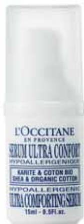
Sérum Ultra Confort Flacon 15ml.

Il permet une meilleure assimilation des soins par la peau.”