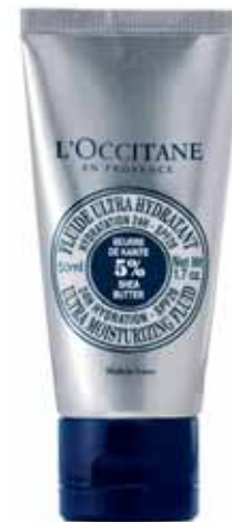
Fluide Ultra Hydratant SPF 20 Tube 50ml.

Vous buvez systématiquement huit grands verres d'eau par jour (dont deux le matin et deux avant le coucher). ”