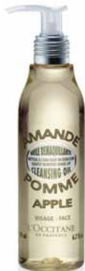
Huile Démaquillante Flacon 200ml.

Au contact de l'eau, elle se transforme en lait et élimine parfaitement traces de maquillage et impuretés tant à la surface de la peau qu'au niveau des pores.