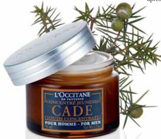
Concentré Jeunesse Pot 50ml.

* Hydratation des couches supérieures de l'épiderme