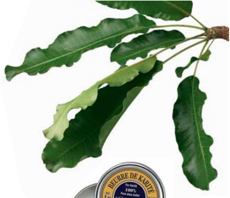
Beurre de Karité Boîte 8ml.

* Hydratation des couches supérieures de l'épiderme