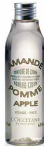
Tonique de Cidre Flacon 200ml.

Cette lotion tonifie et rafraîchit instantanément la peau, et aide à affiner visiblement son grain.