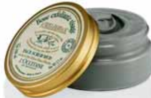
Boue Exfoliante Visage Pot 100ml.

* Hydratation des couches supérieures de l'épiderme