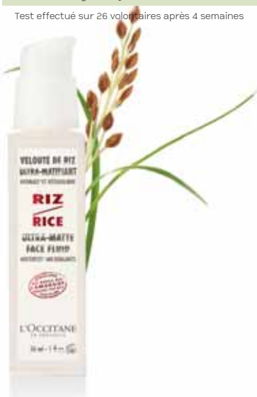
Velouté de Riz Ultra-Matifiant Flacon 30ml.

Test effectué sur 26 volontaires après 4 semaines