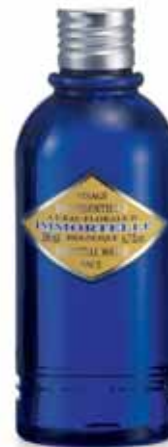
Eau Essentielle Visage Flacon 200ml.

Sa texture onctueuse démaquille en douceur yeux, visage et lèvres et préserve la fraîcheur d'une peau jeune.