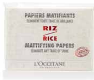
Papiers Matifiants Carnet 50 feuilles.

L'exfoliation, même très douce, active toujours un peu la sécrétion de sébum dans les heures qui suivent. C'est à onze heures du matin que se produit le pic de sébum biologique. Pour éviter de « briller » toute la journée, mieux vaut donc faire ce type de soin avant de se coucher. ”