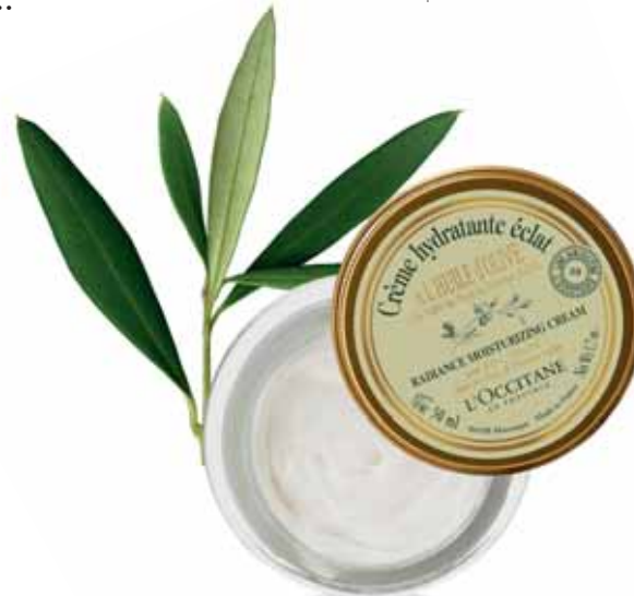
Crème Hydratante* Éclat Pot 50ml.

Test effectué sur 23 volontaires pendant 3 semaines