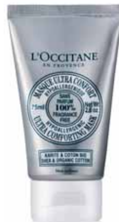
Masque Ultra Confort Tube 75ml.

Un bain de bien-être en seulement 5 à 10 minutes, grâce à sa concentration en beurre de karité protecteur (10%), en extrait de coton biologique adoucissant et en réglisse apaisant.