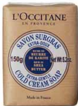
Savon Surgras Extra-Doux Savon 150g.

“ Dans les régions d’Afrique où pousse le Karité, les femmes utilisent son beurre pour tout : cuisiner, protéger l’épiderme de leur nouveau-né, garder une peau et des cheveux souples et bien hydratés* et les protéger naturellement du soleil. Chez nous, le Karité est idéal pour soulager les peaux qui manquent d’eau, mais aussi pour compenser les effets calcaires de l’eau. ”