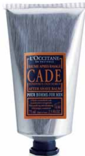
Baume Après Rasage Tube 75ml.

Présenté dans un bol à barbe, comme autrefois, ce savon développe une belle mousse très douce qui facilite le rasage. Le bon réflexe : une brosse à barbe de bonne qualité est idéale pour faire mousser ce savon.