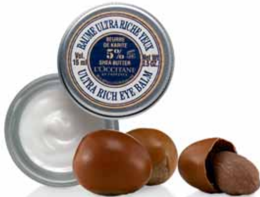
Baume Ultra Riche Yeux Hydratation* 24 heures Pot 15ml.

Test effectué sur 27 femmes pendant 3 semaines