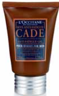
Sève Anti-Fatigue Tube 50ml.

C'est le nom savant donné aux poils de barbe qui repoussent en s'enroulant sous la peau. Gênant... et chez les hommes à peau mate ou sombre ça laisse des marques ! Deux solutions éprouvées : faire un vrai gommage une à deux fois par semaine pour affiner le grain de la peau et faciliter la saillie des poils et appliquer systématiquement après, une crème très hydratante. ”