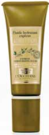
Fluide Hydratant* Express SPF 20 Tube 50ml.

Test effectué sur 24 femmes pendant 3 semaines