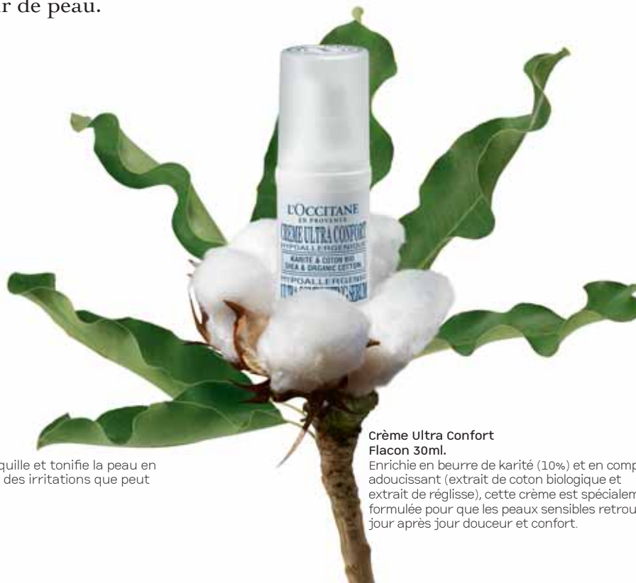
Crème Ultra Confort Flacon 30ml.

* Hydratation des couches supérieures de l'épiderme