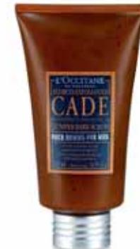
Écorces Exfoliantes Tube 125ml.

* Hydratation des couches supérieures de l'épiderme