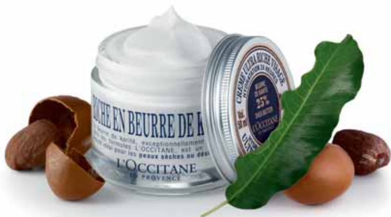
Crème Ultra Riche Visage Hydratation* 24 Heures Pot 50ml.

(2) Test effectué sur 24 femmes pendant 3 semaines