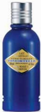
Lait Démaquillant Flacon 200ml.

Le bon réflexe : agitez avant utilisation pour que les deux phases s'émulsionnent.