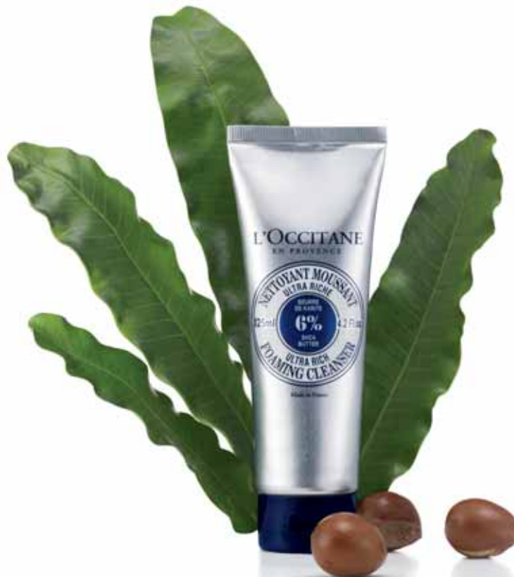
Nettoyant Moussant Ultra Riche Tube 125ml.

Tout doux, ce savon est riche en beurre de karité et en cold cream. Le bon réflexe : nettoyez votre visage deux fois par jour, en faisant mousser avec de l’eau tiède.