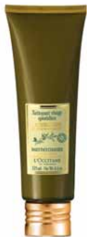
Nettoyant Visage Quotidien Tube 125ml.