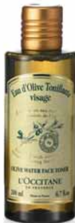
Eau d'olive Tonifiante Visage Flacon 200ml.

Le bon réflexe : utilisez le matin sur peau humide, pour réveiller la peau, et le soir, même si vous ne vous maquillez pas, pour éliminer toute trace de poussière et de salissure présentes dans notre environnement.