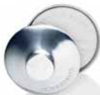
Bol et Savon à Barbe Savon 100g.

Cette crème riche en huile essentielle de Cade, beurre de karité et glycérine, se transforme en une mousse douce et protectrice. Le bon réflexe : peu de produit suffit, émulsionnez avec un peu d'eau chaude pour une mousse généreuse.