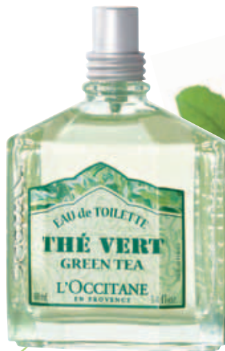
1. Туалетная Вода Зеленый Чай Флакон 100 мл. Спрей.