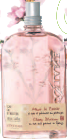
3. Туалетная Вода Вишневый Цвет Флакон 100 мл. Спрей.