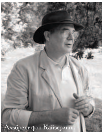
Альбрехт фон Кайзерлинг