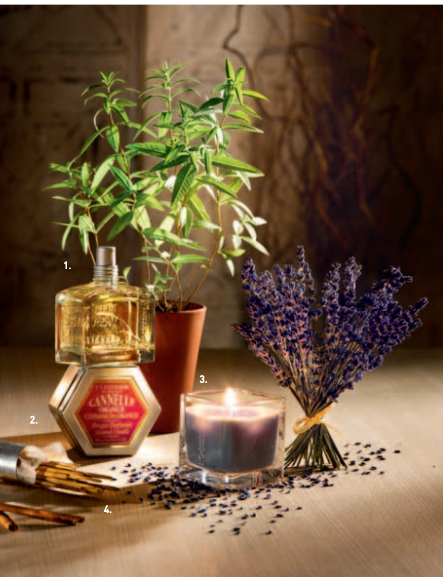
1. Ароматизатор для Интерьера Вербена > 100 мл. / 2. Ароматическая Свеча Корица-Апельсин > 100 г. / 3. Ароматическая Свеча Лаванда > 100 г. / 4. Ароматические Палочки Зимний Лес (40 шт.)