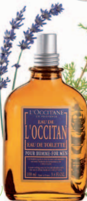
4. Туалетная Вода Eau de L'Occitan Флакон 100 мл. Спрей.