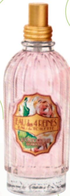
2. Туалетная Вода 4 Королевы Флакон 75 мл. Спрей.