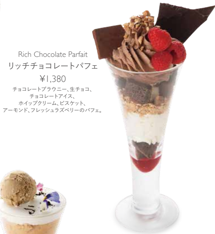
Rich Chocolate Parfait リッチチョコレートパフェ ¥1,380 チョコレートブラウニー、生チョコ、 チョコレートアイス、 ホイップクリーム、ビスケット、 アーモンド、フレッシュラズベリーのパフェ。