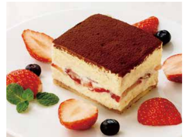
Strawberry Tiramisu ストロベリーティラミス ¥980 旬の苺を使用した、 ほんのリビターで甘酸っぱいティラミス。