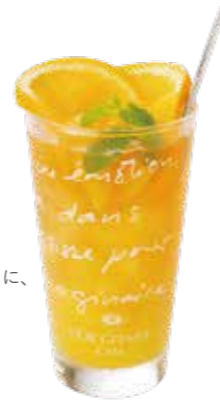
Orange Iced Tea オレンジアイスティー ¥980