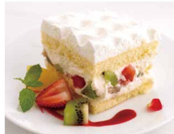
Seasonal Fruits Shortcake 旬フルーツのガトーマルシェ ¥880 旬の果実とハチミツの甘さが優しいクリームを 軽い食感のスポンジでサンド。

DRINK SET ドリンクセット デザートとあわせてご注文いただいたアルコール以外のドリンクは、税込¥200円引きです ※Drinks ordered with dessert are discounted by 200 yen (including tax) ※Not applicable to alcoholic drinks