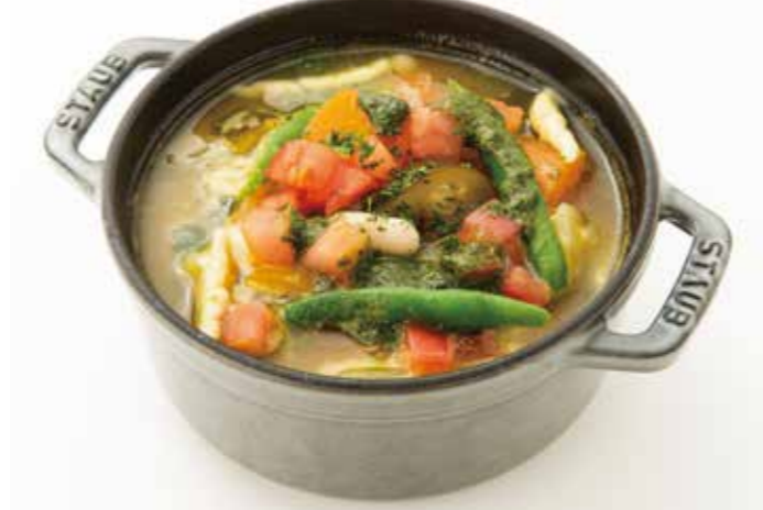
Provence Soup with Chicken and Vegetables (with bacon) ※comes with bread

彩りよい12種の野菜とイタリア産プロシュートをあわせのお食事サラダ。 プロヴァンスの名産トリュフの香るドレッシングで。