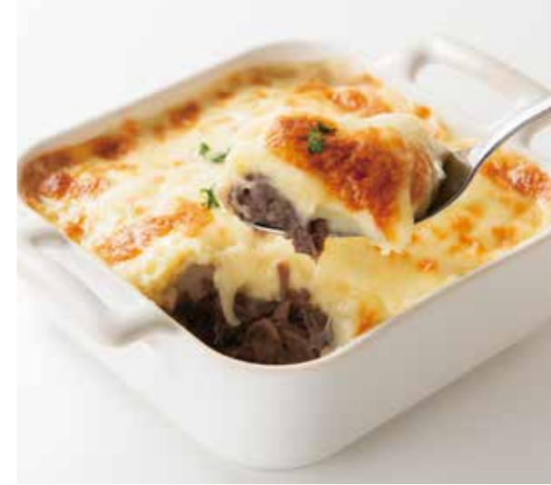
Hachis Parmentier (Beef and Potato Gratin) ※comes with bread

アシ パルマンティエ(パン付) ※牛煮込肉とマッシュポテトのグラタン à la carte / 単品 ¥1,480