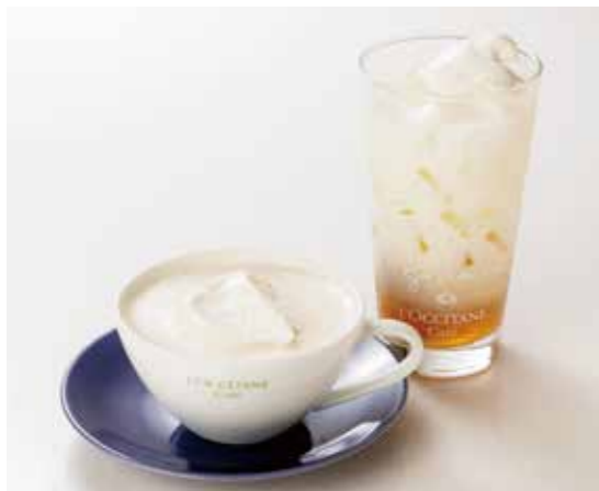
L'OCCITANE Tea au Lait ティーオレ ロクシタン ¥880 生クリームをトッピングしたロイヤルミルクティー。