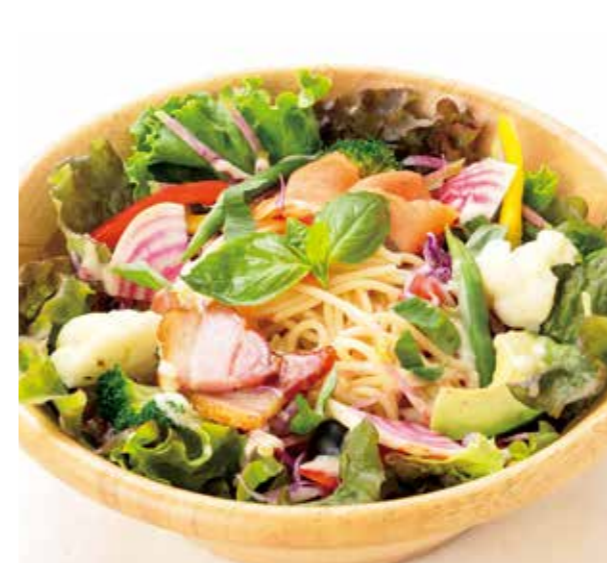
L'OCCITANE Salad Pasta ※with bacon, smoked salmon and avocado

ハムとベシャメルソース、チーズで焼き上げたクロックムッシュに、 ハーブのきいたトマトマリネを添えて。