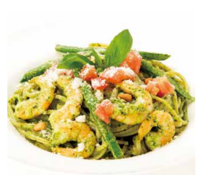
Shrimps and Basil Pasta シュリンプバジルパスタ à la carte / 単品 ¥1,280

アンチョビ入りオイルベースの温製パスタとたっぷり野菜に、 ベーコン、スモークサーモン、アボカドをトッピングし、 自家製フレンチドレッシングで仕上げたサラダ感覚のパスタ。