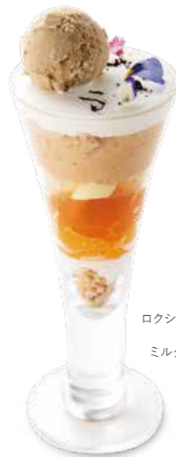
L'OCCITANE Tea Parfait ロクシタン ティーパフェ ¥1,280 ロクシタンカフェ人気のティーメニューをパフェに。 アールグレイアイスクリーム・ ミルクティープリン・ハニーレモンティーゼリー・ オレンジ果実の組みあわせ。