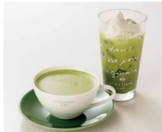
Uji Matcha au Lait プレミアム抹茶オレ ¥880 宇治抹茶のティーオレ。