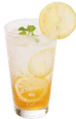
Honey Lemon Tea Soda ハニーレモンティーソーダ ¥980

ベルギー産ホワイトチョコとアーモンドミルクのホットチョコレートにホイップクリームとマシュマロチョコレートをトッピング。