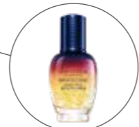
ロクシタンベストセラーに インスパイアされた ハーブとフルーツのゼリー