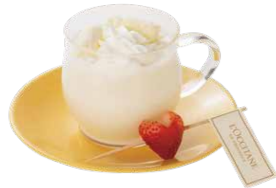
Almond Milk White Hot Chocolate アーモンドミルクのショコラショブラン ¥980

ストロベリーピューレ入りソーダにホイップクリームとローズアイスクリームをトッピングしたクリームソーダ。 ※アイスクリームをバニラ変更できます