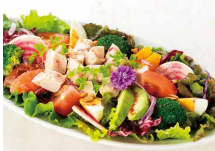
Low Carb Salad of Chicken Breast, Citrus and Avocado, Raspberry Dressing ※comes with bread

スモークサーモン・アボカド・ゆで卵に新鮮な野菜と アーモンド・スパイシーな香りのイモテルの花をあわせのお食事サラダ。