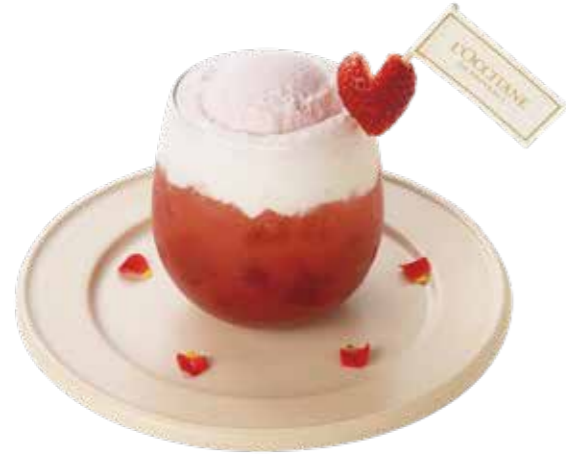
Strawberry and Rose Cream Soda ストロベリー&ローズ クリームソーダ ¥980

ストロベリーピューレ入りソーダにホイップクリームとローズアイスクリームをトッピングしたクリームソーダ。 ※アイスクリームをバニラ変更できます