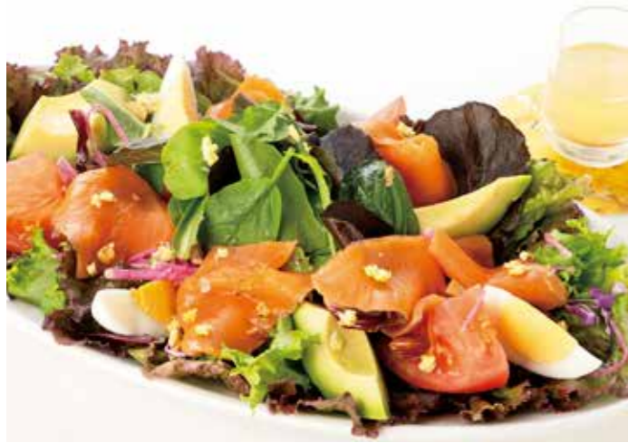
摘みとった後も永遠に咲く花[イモテル]入り。 Smoked Salmon and Avocado Salad, Lemon and Immortelle Dressing ※comes with bread