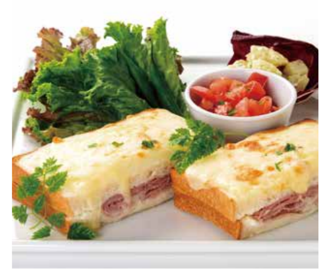
Provence Croque-Monsieur クロックムッシュ プロヴァンス

赤ワイン風味の牛煮込肉ときのこにマッシュポテトを重ね、 チーズをのせて熱々に焼き上げたフランスの代表的な家庭料理。