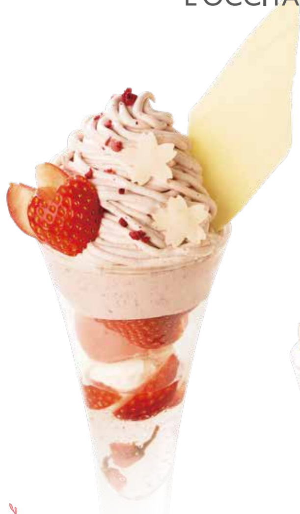
Cherry Blossoms and Strawberry Parfait チェリーブロッサムと 苺のパフェ ¥1,480 旬の苺にほんのり塩味のきいた桜花アイス、 苺シャーベット、チェリームース、桜のゼリーをあわせ、 チェリー入りクリームチーズをあわせたクリームで モンブラン仕立てに。