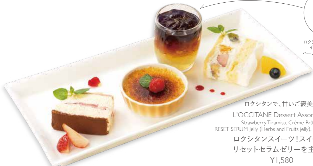
ロクシタンで、甘いご褒美を。 L'OCCITANE Dessert Assortment Strawberry Tiramisu, Crème Brûlée, RESET SERUM Jelly (Herbs and Fruits jelly), Fruits Shortcake ロクシタンスイーツ!スイーツ! リセットセラムゼリーを主役に ¥1,580

天然ハーブを使用した華やかなリセットセラムゼリーは、リラックスにも!! [ストロベリーティラミス・クレームブリュレ・ リセットセラムゼリー(ハーブ&フルーツゼリー)・フルーツガトーマルシェ]