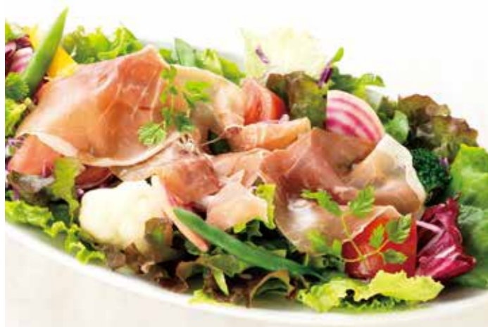
Prosciutto Salad, Truffle Oil Dressing ※comes with bread

ヘルシーな鶏胸肉、オレンジ、グレープフルーツ、アボカド、卵、アーモンド、 野菜の低糖質なパワーサラダを フルーティーなラズベリーピューレ入りドレッシングで。