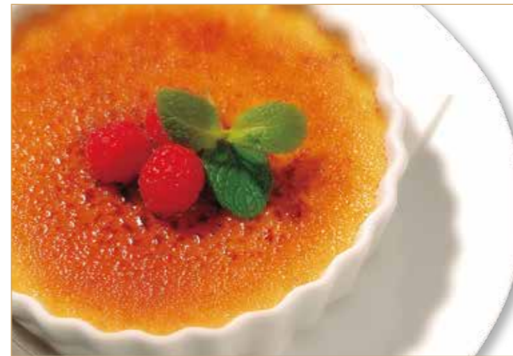
L'OCCITANE Crème Brûlée クレームブリュレ ロクシタン ¥880 ロクシタンカフェ人気No1 ほろ苦いカラメルを割ると、 中にはバニラビーンズたっぷりの濃厚プリンが。